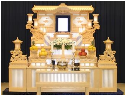
白木五段祭壇の場合 579,200円 税別