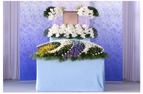
花祭壇 Bタイプの場合 649,200円 税別

各祭壇に下記項目が共通して含まれます。人数の超過が無ければ追加料金はありません。