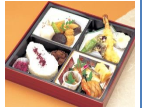
通夜料理 75名様対応分 寿司・揚げ物・煮物・香の物 ※握り寿司のプランもあります 告別式お膳 20名