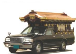
霊柩車・マイクロバス