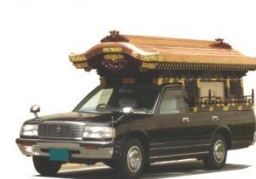
霊柩車 有・バス 無