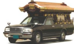
霊柩車 有・バス 無