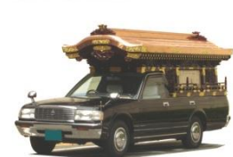
霊柩車 有・バス 無