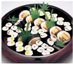
通夜料理 25 名様対応分

各祭壇に下記項目が共通して含まれます。人数の超過が無ければ追加料金はありません。