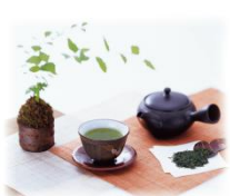
返礼品 25 セット