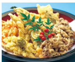
寿司・揚げ物・煮物・香の物