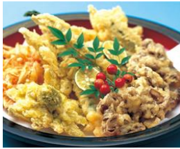
寿司・揚げ物・煮物・香の物