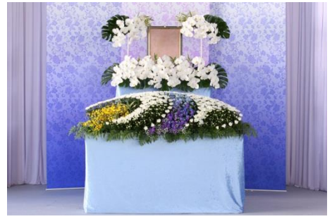
花祭壇 B タイプの場合