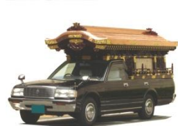
霊柩車有・バス無