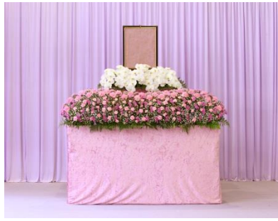
花祭壇 A タイプの場合