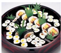
通夜料理 25名様対応分

各祭壇プランに下記項目が共通して含まれます。人数の超過が無ければ追加料金はありません。