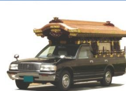
霊柩車・マイクロバス