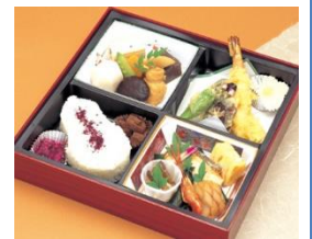
通夜料理 25名様対応分 寿司・揚げ物・煮物・香の物 ※握り寿司のプランもあります 告別式お膳 10名