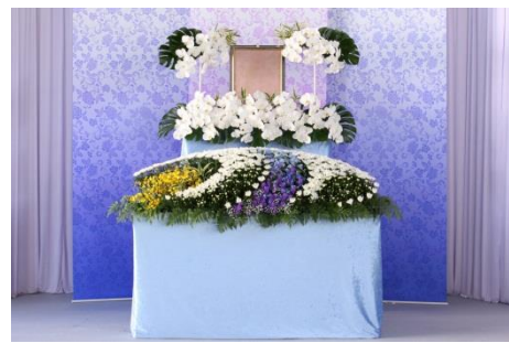
花祭壇 B タイプの場合